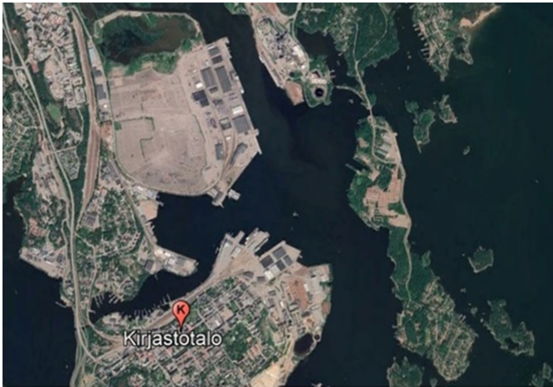
Kuva 3/L1. Enwin Oy:n ilmanlaadun tarkkailupiste Kotkassa.