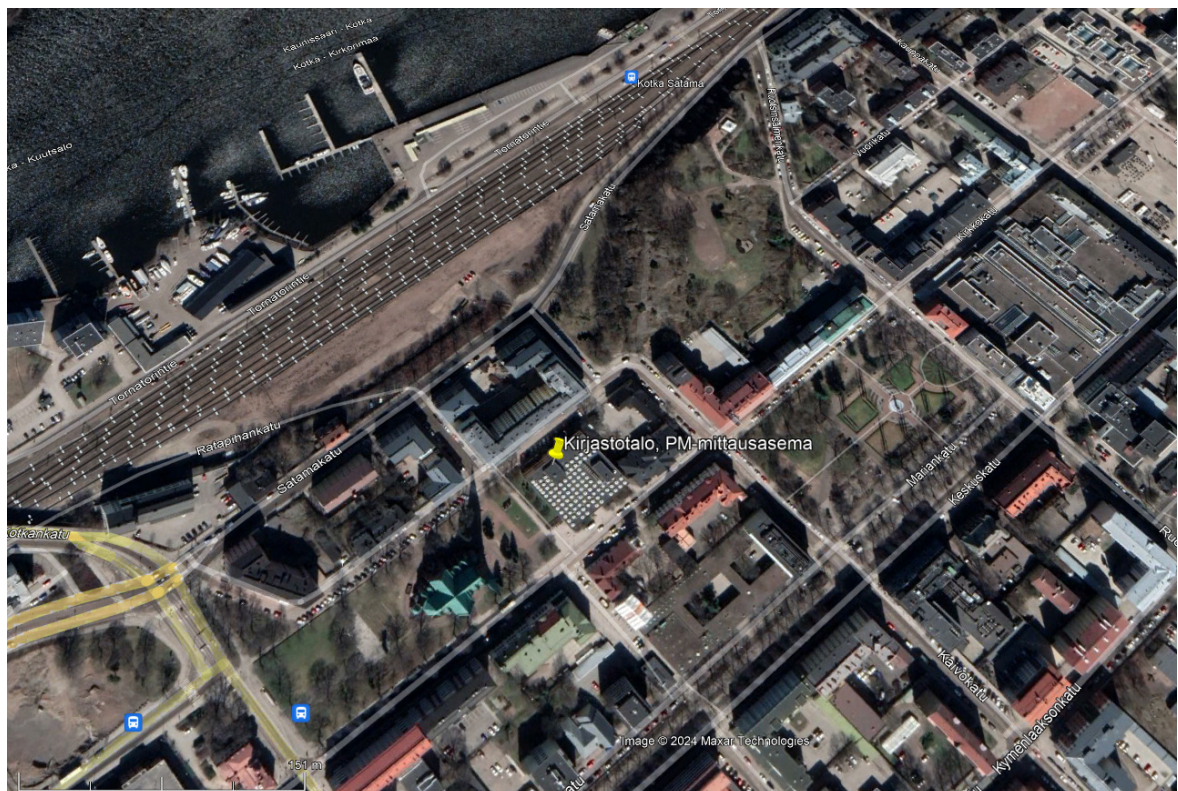
Kuva 2/L1. Kotkan kirjastotalon hiukkasmittausasema kartalla, lähikuva.

TRS virtuaaliaseman sijainti Kotkassa on sama kuin Kirjastotalon hiukkasmittausasema.