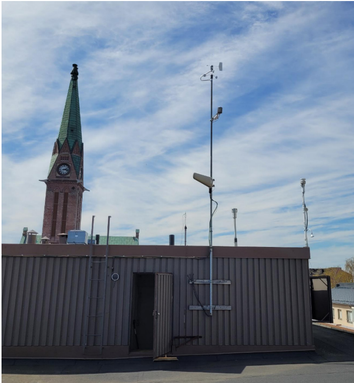
Kuva 1/L1. Kirjastotalon hiukkasmittausasema