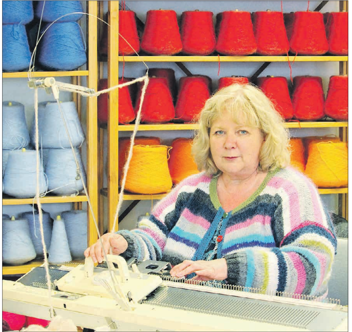
Outi työnsä äärellä.