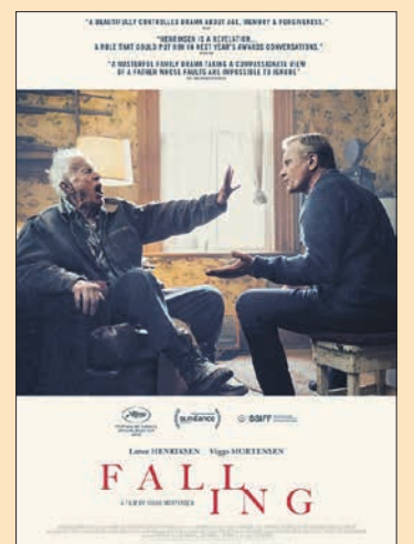
8.12. Viggo Mortensen: Falling (USA 2020, 112 min)