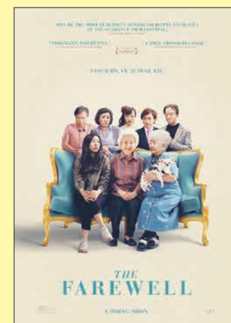
23.9.2021 Lulu Wang: JÄÄHYVÄISET The Farewell (Yhdysvallat 2019, 100 min)