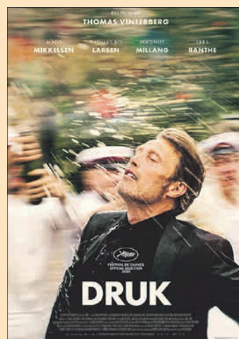
1.12. Thomas Vinterberg: Yhdet vielä Druk (Tanska 2020, 117 min)