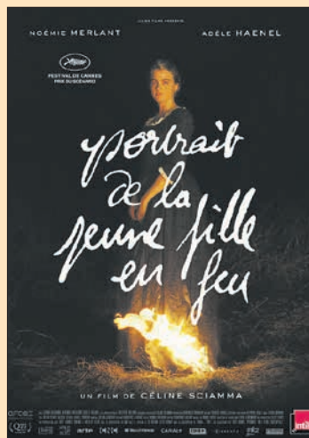
6.10. Céline Sciamma: Nuoren naisen muotokuva Portrait de la jeune fille en feu (Ranska 2019, 119 min)