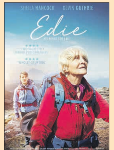
3.11. Simon Hunter: Edie (Iso-Britannia 2017, 102 min)