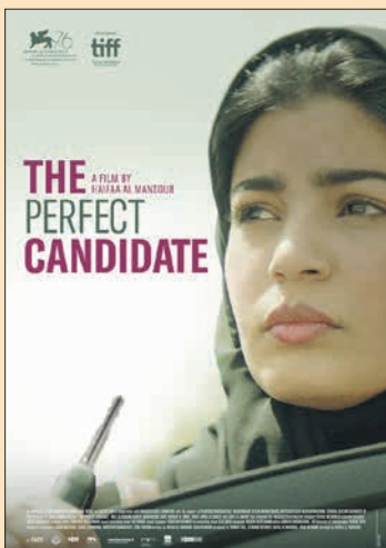
29.9. Haifaa Al Mansour: Maryam The Perfect Candidate (Saudi-Arabia 2019, 104 min)