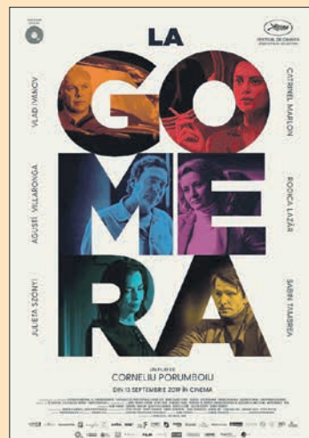
20.10. Corneliu Porumboiu: The Whistlers / La Gomera (Romania 2019, 90 min)