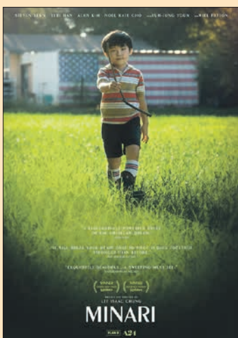
10.11. Lee Isaac Chung: Minari (USA 2020, 115 min)