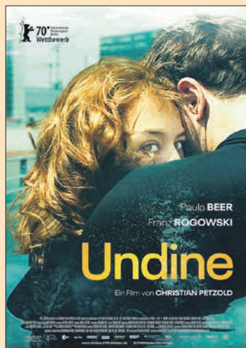
13.10. Christian Petzold: Undine – Aallotar (Saksa 2020, 90 min)