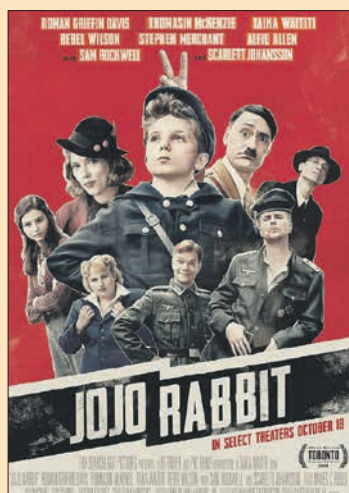
24.11. Taika Waititi: Jojo Rabbit (USA 2019, 108 min)