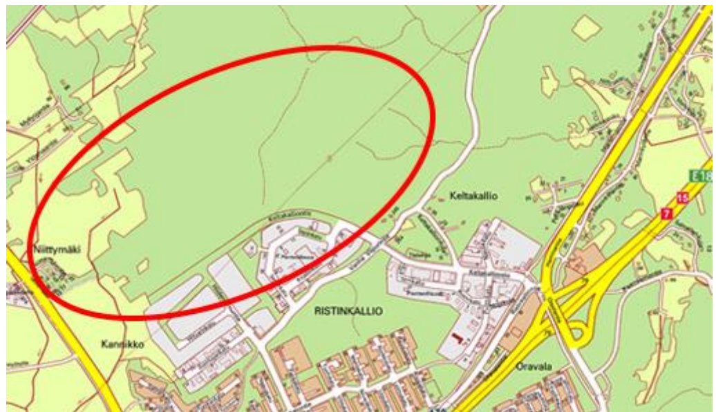
Suunnittelualueen alustava rajausta

Suunnittelualueen laajuus on noin 100 ha. Suunnittelualueen rajausta tarkentuu työn edetessä. Suunnittelualueen osoite Keltakalliontie, 48770 Kotka.