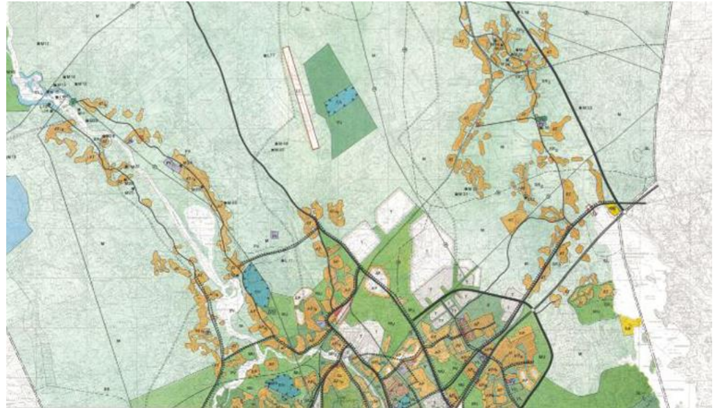
Ote Kotkan yleiskaavasta

Kotkan yleiskaavassa alue on osoitettu teollisuusalueeksi, T. Kotkan yleiskaava on hyväksytty 19.3.1986. Kaava on oikeusvaikutuksen.