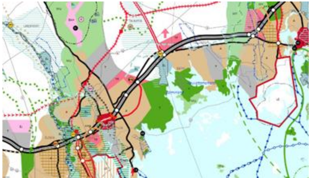
Ote Kymenlaakson maakuntakaava 2040 ehdotuksesta