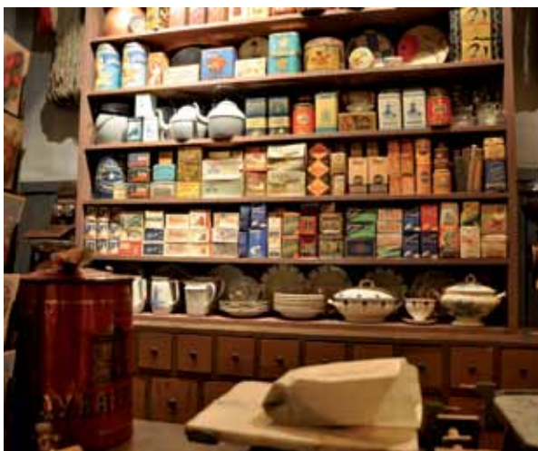
Puotimuseon esineistöä.

Puotimuseon kokoelma sisältää kaupankäyntiin liittyvää aineistoa. Ajallisesti kokoelman esineistö ajoittuu pääasiallisesti 1800-luvun lopulta 1960-luvun lopulle. Suurin osa kokoelman esineistä on ollut käytössä tai valmistettu muualla kuin nykyisen Kouvolan alueella. Esineistöstä osa on peräisin nykyisen Kouvolan kyläkaupoista (mm. Liikkala, Muhniemi, Kaipainen, Utti). Esineistö painottuu esineisiin, joita kyläkaupoissa on myyty. Osa esineistä on alkuperäispakkauksissaan ja käyttämättömiä. Suuren kokonaisuuden muodostavat erilaiset elintarvikepakkaukset, kuten mm. karamellirasiat (arviolta 500-1000 pakkausta), joita on useilta eri valmistajilta (mm. Fazer, Hellas, Chymos). Kahvisokeri-, tee- ja tupakkapakkauksia ja maustepurkkeja on runsaasti. Kokoelma sisältää lisäksi myös mm. posliini-, emali- ja peltiastioita, tekstiilejä (sukkia, paitoja, housuja yms) nappeja, hakasia, lankoja, kangaspakkoja, työkaluja. Kokoelma sisältää myös kalusteita. Kokoelmissa on joitakin kauppias Jaakko Pokille kuuluneita esineitä.