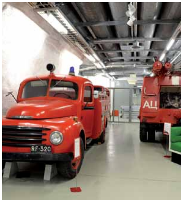
Palomuseon kokoelmiin kuuluvia paloautoja.

Palomuseon kokoelman esineet ovat olleet käytössä Verlan tehdaspalokunnalla, Kymi Kymmene Oy:llä, Voikkaan tehdaspalokunnalla sekä Hallan vapaapalokunnalla. Museo on keskittynyt keräämään Kymenlaakson alueen pelastuslaitoksen historiaa 1900-luvun alusta bensakone-aikakaudelle asti. Kokoelmissa on mm. paloautoja, ruiskuja, letkuja, naamareita ja työasuja, kypäriä ja palosammutuskalustoa.