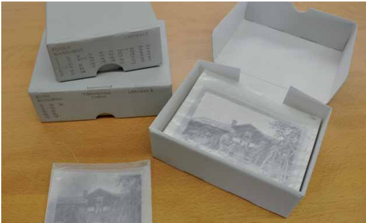
Valokuvien säilyttäminen.