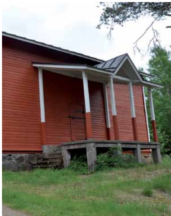
Sippolan viljamakasiini.