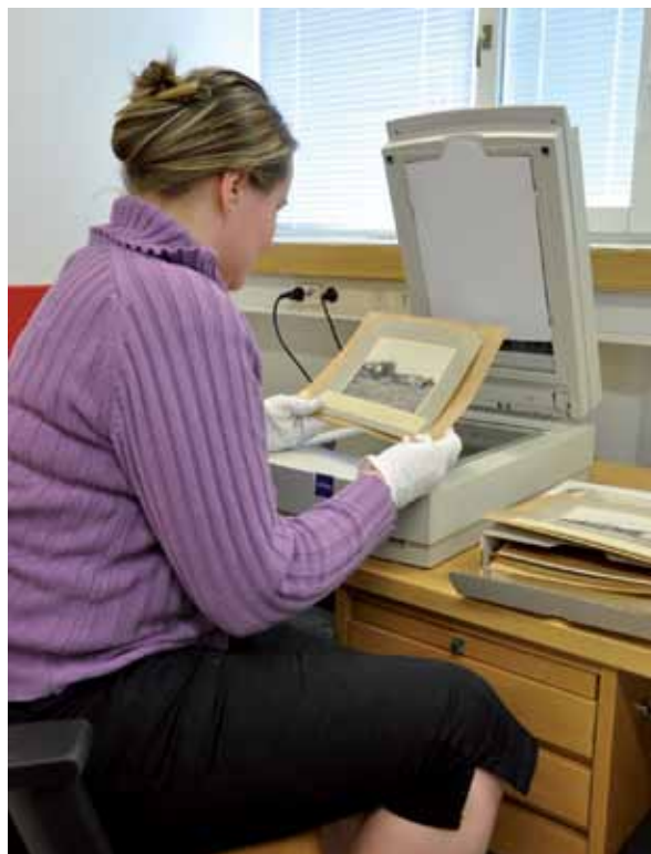
Kuvien skannaaminen.

Vuosina 2011–2012 laaditaan digitointisuunnitelma, missä pyritään arvottamaan kuva-aineisto sekä erottamaan ensisijaista digitointia vaativa aineisto.