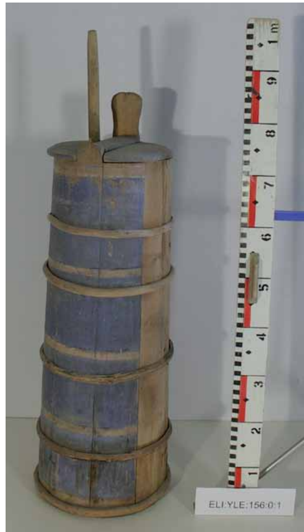
Kirnu. Elimäen kokoelma.

Vuonna 2008 Kouvolan kotiseutukokoelmassa oli 1752 päänumeroa. Esinemäärä on 3940. Kouvolan kokoelma eroaa muista yleiskokoelmista sisältönsä puolesta. Kokoelmiin on luetteloitu erittäin paljon arkistoaineistoa (981 kpl), kirjoja (456 kpl) ja valokuvia (547 kpl). Valokuvat on aikoinaan siirretty valokuva-arkistoon, jossa ne numeroidaan uudestaan. Valokuvat voidaan poistaa esinekkokoelmasta. Kouvola-seuran aikaisista luetteloinneista 731 esineelle pitäisi antaa uusi numero ja selvittää, onko esine jo mahdollisesti luetteloitu uudelleen. Arviolta kokoelmiin kuuluu noin 1000 luettelomatonta esinettä. Kokoelmaan on luetteloitu myös noin parikymmentä Rautatiemuseolta vuonna 1957 lainaksi saatua esinettä, joita ei vielä kaikkia ole palautettu takaisin Rautatiemuseoon, koska niitä ei ole pystytty tunnistamaan. Kouvolan kotiseutukokoelmassa on esineitä liittyen rautatiehistoriaan ja rautatieläisyyteen (108) sotilashistoriaan (183), lähialueiden kartanokulttuuriin (Kouvolan, Kirjokiven, Kallioisten ja Oravalan kartanot), talonpoikauskulttuuriin sekä paikkakunnan yritystoimintaan. Oman kokonaisuutensa muodostaa suutari Hirvosen suutarinverstaan esineistö (108 kpl). Vanhimmat esineet ovat 1700-luvulta, uusimmat 1950-luvulta. Ajallisesti painottuvat 1800- ja 1900-luvun vaihteen esineistö.