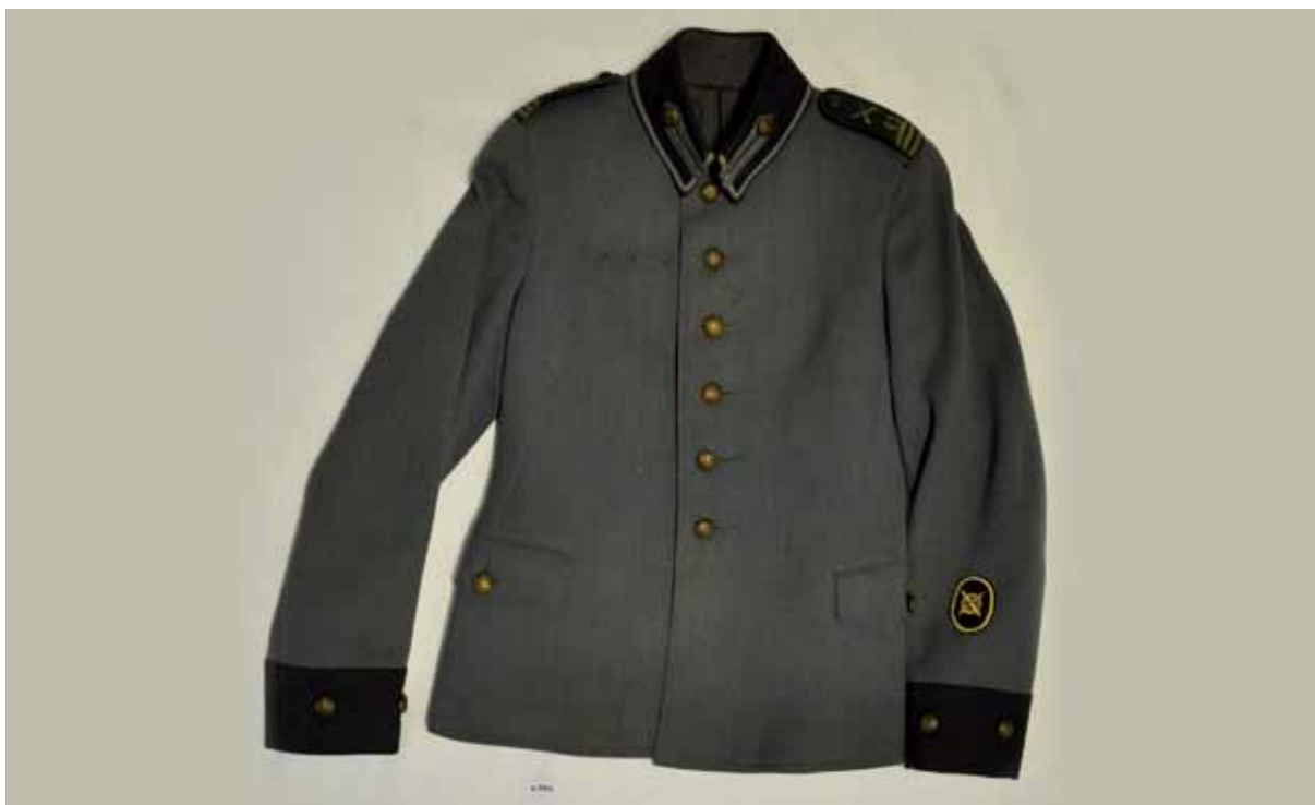
Keski-Suomen Rykmentin asetakki. Kouvolan esinekokoelma.