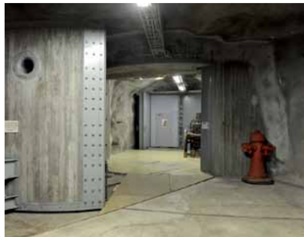
Kuusankosken palomuseon sisäänkäynti.